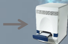
Caricare sul termociclatore